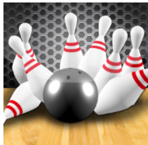
ボーリングゲーム