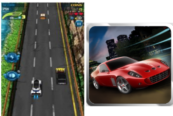
スピード・レーシング