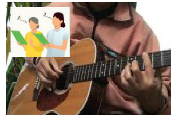
ギター生演奏と合唱