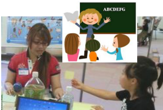
英会話・英語ソング