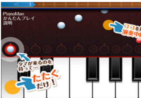
かんたんピアノ演奏