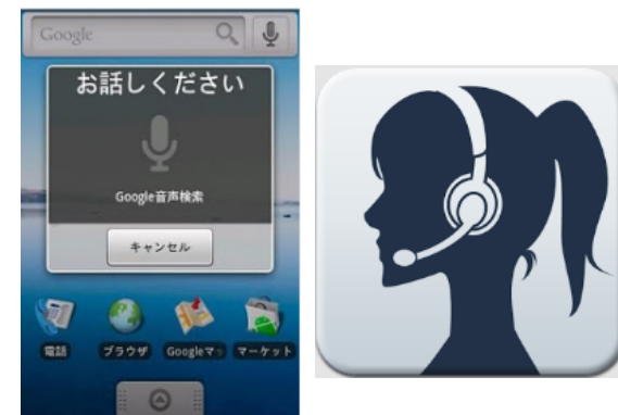
声で生活サービス